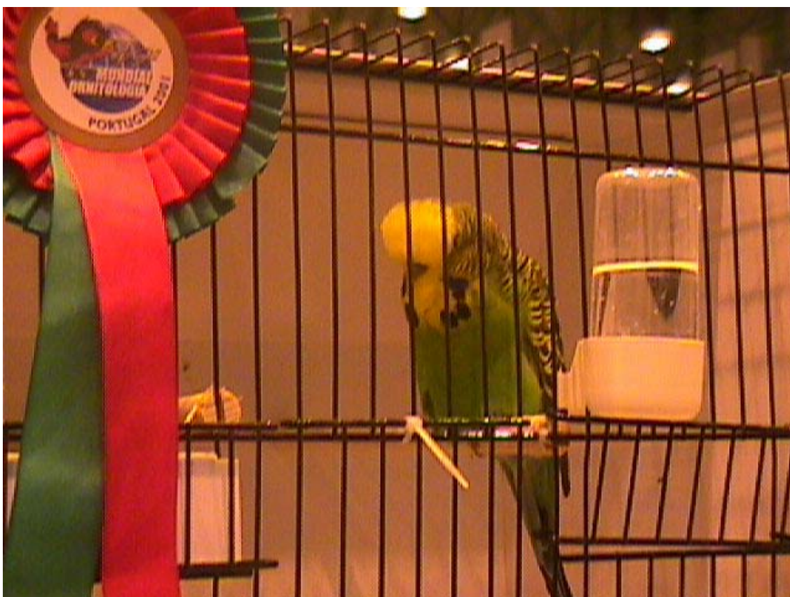
PERIQUITO INGLES CAMPEÓN DEL MUNDO 93 PUNTOS (MUNDIAL PORTUGAL 2001)